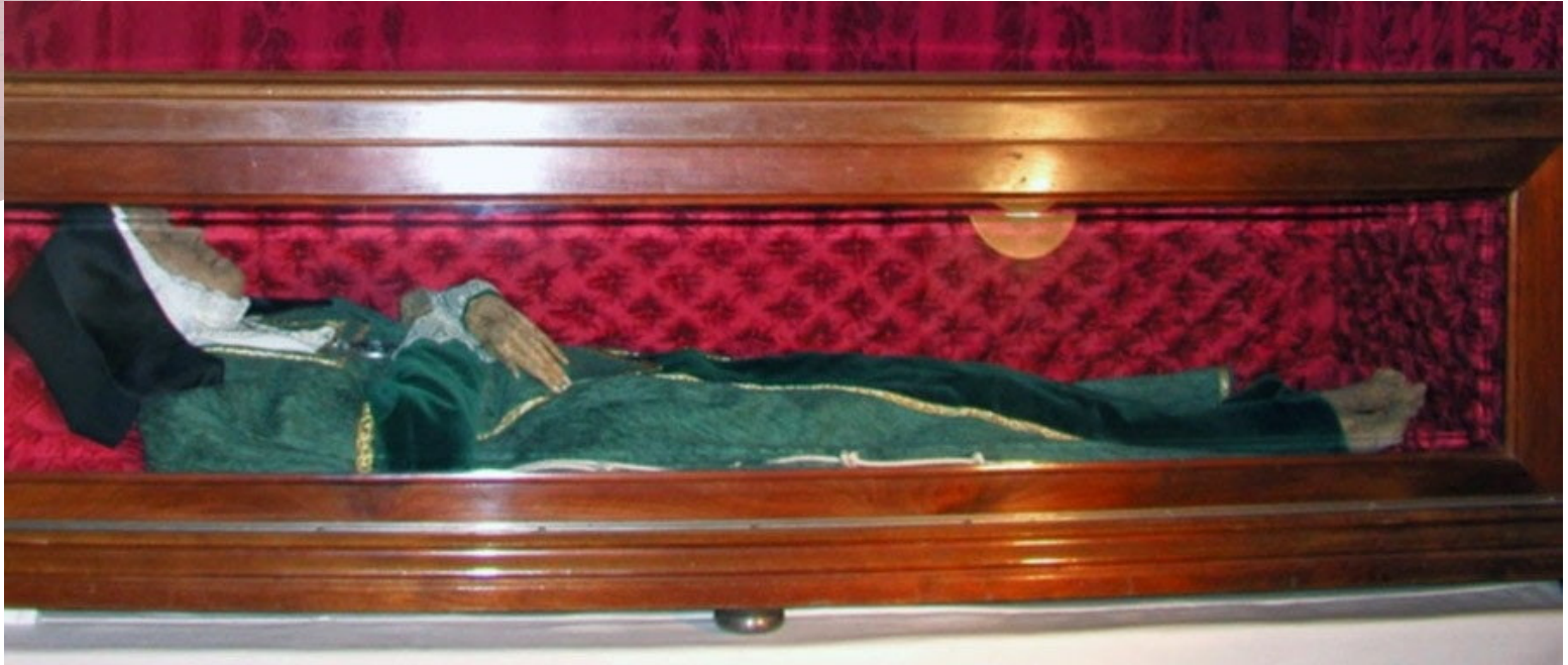
Foto: restos incorruptos de la Venerable Teresa Enríquez de Alvarado.

Impulsó un colegio de huérfanos y un sistema de dotación para chicas huérfanas. Trabajó por la reinserción de prostitutas, buscándoles oficio y marido. El padre Contreras, llamado por algunos "apóstol de la Berbería", estaba volcado en rescatar cautivos de los moros en el Norte de África, y ella colaboraba en financiar esos rescates. También creó escuelas para médicos y músicos.