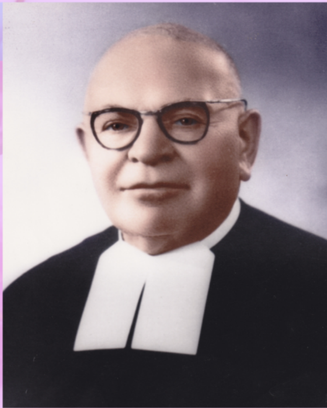
FUNDADOR DE LAS HERMANAS GUADALUPANAS DE LA SALLE