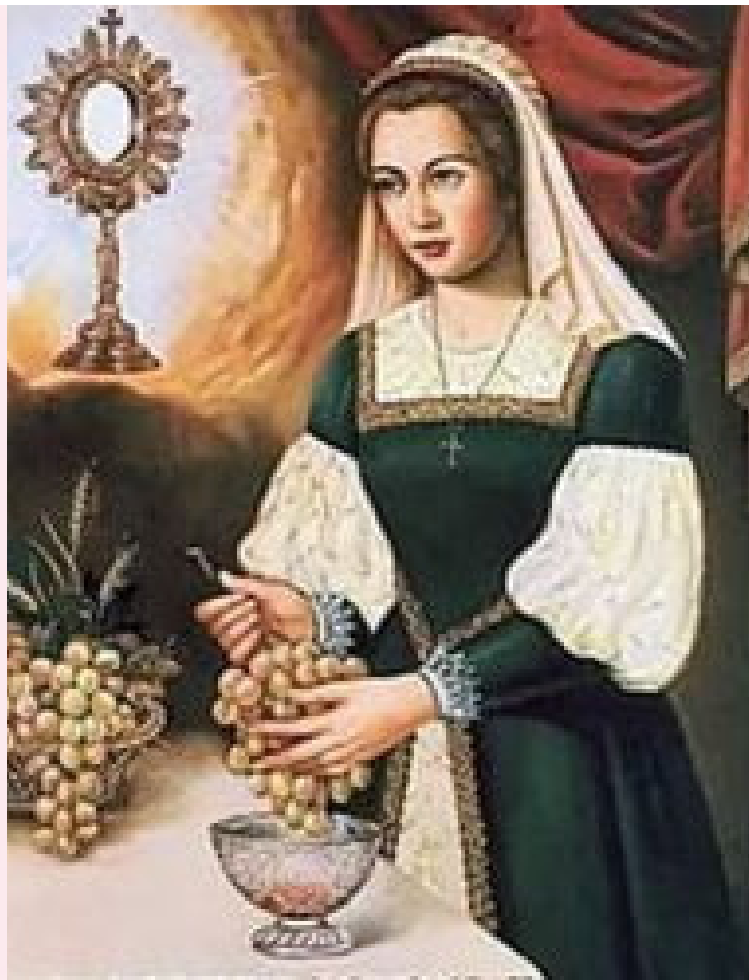
Foto: Venerable Teresa Enríquez de Alvarado.

Fue un ejemplo de la intensa creatividad para el bien del incipiente Renacimiento en clave católica en España. Con su dinero impulsó el primer hospital moderno, de la península, higienista y muy ventilado, saliendo de viejos criterios medievales, financiando su funcionamiento. También se volcó en persona en atender heridos y enfermos: acudió a la Guerra de Granada y acompañaba personalmente a los soldados heridos o moribundos. Fue amiga personal de la cultísima Beatriz Galindo, "La Latina", maestra de Isabel la Católica, y también de Beatriz de Bobadilla, consejera de la reina, el círculo de damas renacentistas castellanas, a la vez muy cultas y muy religiosas.